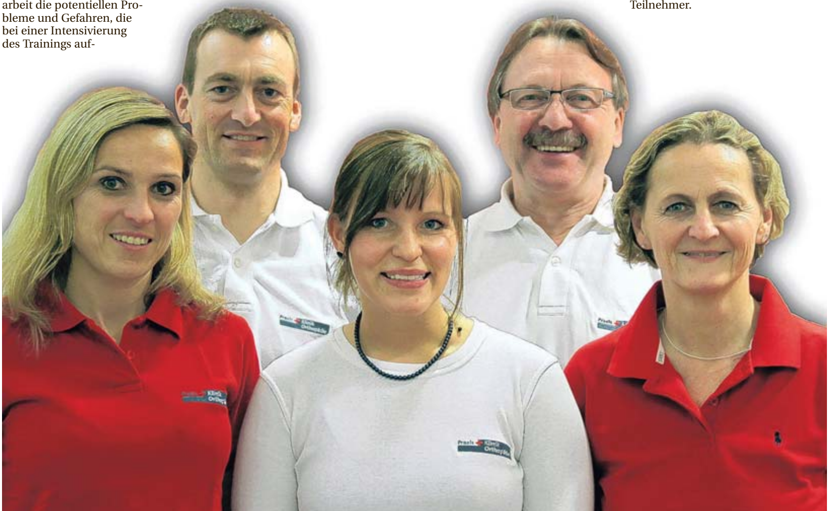
Das Team der Orthopädie Praxisklinik im Heilig-Geist-Spital macht die Teilnehmer der Reischmann Berlin Marathon Aktion körperlich fit.

Für die meisten Berlin-Marathon-Bewerber blieb die Untersuchung allerdings eine Routinemaßnahme. „Wie schon in den Vorjahren zeigte sich, dass Bewerber wichtige Erfahrungen aus dem Hobby-Laufsport oder anderen Sportarten mitbringen“, sagte Sportmediziner Dr. Fähn-